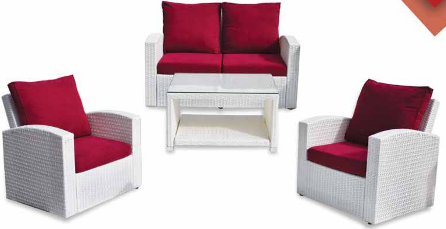
HAZAL OTURMA GRUBU