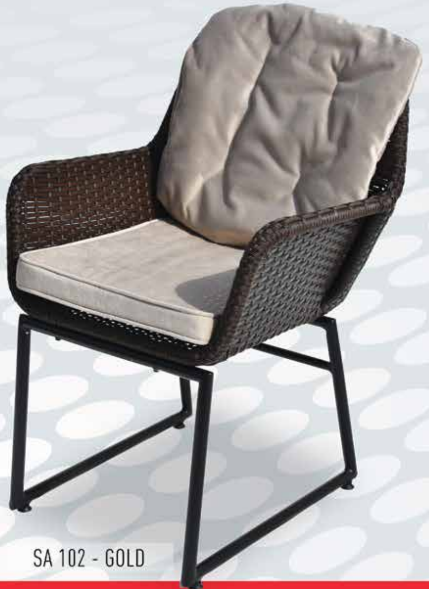
SA 102 - GOLD