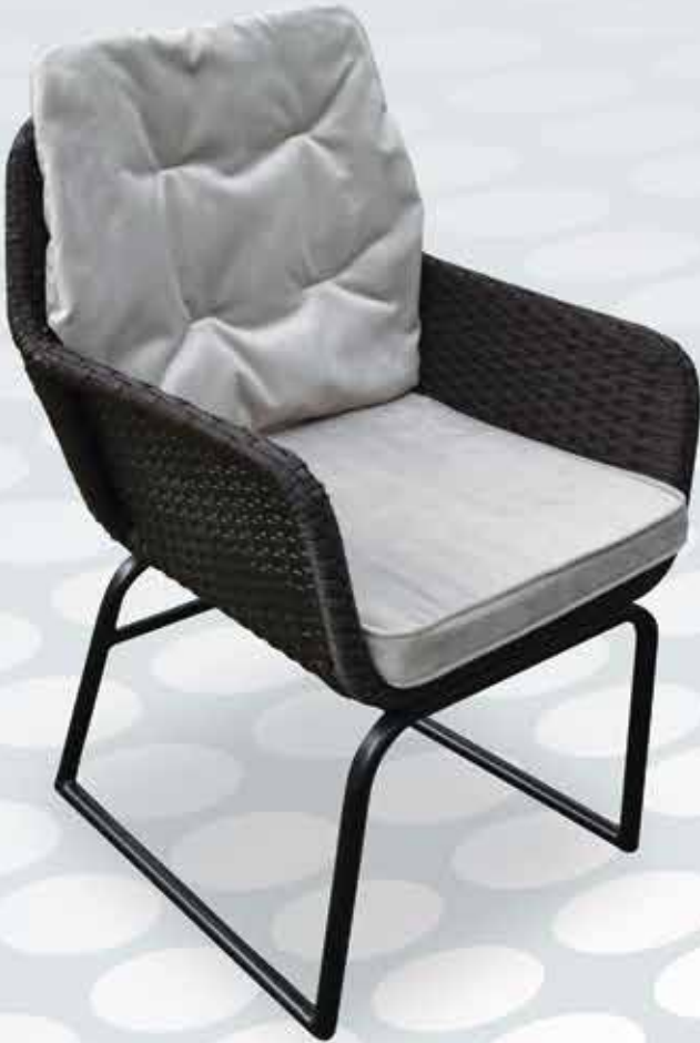
SA 101 - GOLD