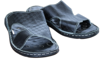
DERİ TERLİK Konya E Tipi Kapalı Ceza İnfaz Kurumu İşyurdu Müdürlüğü Fiyat : 400 TL