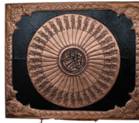
BAKIR TABLO (ORTA BOY) Alanya L Tipi Kapalı Ceza İnfaz Kurumu İşyurdu Müdürlüğü Fiyat : 1250 TL