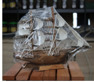
AHŞAP GEMİ (KÜÇÜK BOY) Karaman M Tipi Kapalı Ceza İnfaz Kurumu İşyurdu Müdürlüğü Fiyat : 500 TL