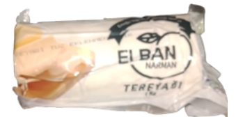
TEREYAĞI 1000 GR Narman Açık Ceza İnfaz Kurumu İşyurdu Müdürlüğü Fiyat : 520 TL