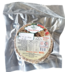
DANA KAVURMA 90 GR Tokat T Tipi Kapalı ve Açık Ceza İnfaz Kurumu İşyurdu Müdürlüğü Fiyat : 150 TL