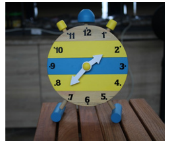
AHŞAP OYUNCAK YAPBOZ SAAT Tavşanlı T Tipi Kapalı ve Açık Ceza İnfaz Kurumu İşyurdu Müdürlüğü Fiyat : 250 TL