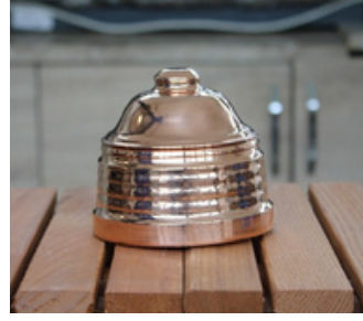
BAKIR ŞEKERLİK Kahramanmaraş Açık Ceza İnfaz Kurumu İşyurdu Müdürlüğü Fiyat : 300 TL