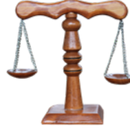
AHŞAP ADALET TERAZİSİ Karaman M Tipi Kapalı Ceza İnfaz Kurumu İşyurdu Müdürlüğü Fiyat : 300 TL