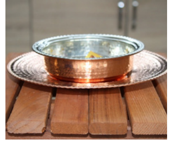
BAKIR ÇORBA KASESİ VE ALTLIĞI Kahramanmaraş Açık Ceza İnfaz Kurumu İşyurdu Müdürlüğü Fiyat : 450 TL