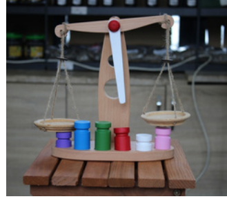
AHŞAP OYUNCAK TERAZİ Tavşanlı T Tipi Kapalı ve Açık Ceza İnfaz Kurumu İşyurdu Müdürlüğü Fiyat : 450 TL