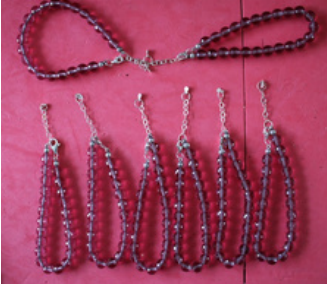
ZULTANIT TAŞI BİLEKLİK Balıkesir L Tipi Kapalı Ceza İnfaz Kurumu İşyurdu Müdürlüğü Fiyat : 1000 TL