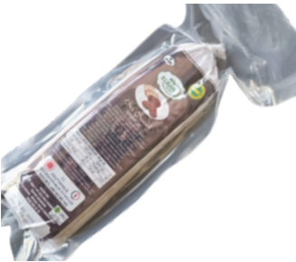
TOKAT BEZ SUCUK Tokat T Tipi Kapalı ve Açık Ceza İnfaz Kurumu İşyurdu Müdürlüğü Fiyat : 1300 TL /kg