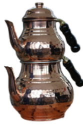
BAKIR ÇAYDANLIK Kahramanmaraş Açık Ceza İnfaz Kurumu İşyurdu Müdürlüğü Fiyat : 1600 TL