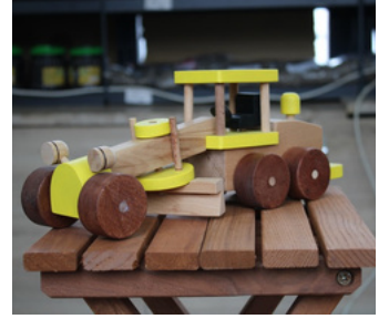
AHŞAP OYUNCAK GREYDER Tavşanlı T Tipi Kapalı ve Açık Ceza İnfaz Kurumu İşyurdu Müdürlüğü Fiyat : 400 TL