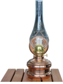
BAKIR GAZ LAMBASI (KÜÇÜK) Kahramanmaraş Açık Ceza İnfaz Kurumu İşyurdu Müdürlüğü Fiyat : 550 TL