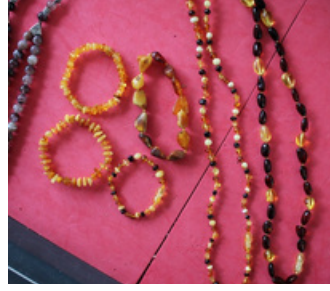
DAMLALI KEHRIBAR TAKI Midyat M Tipi Kapalı Ceza İnfaz Kurumu İşyurdu Müdürlüğü Fiyat : 50 TL/gr