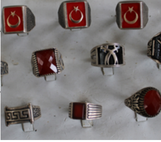
GÜMÜŞ TAKI Midyat M Tipi Kapalı Ceza İnfaz Kurumu İşyurdu Müdürlüğü Fiyat : 230 TL/gr