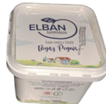
BEYAZ PEYNİR 500 GR Narman Açık Ceza İnfaz Kurumu İşyurdu Müdürlüğü Fiyat : 120 TL