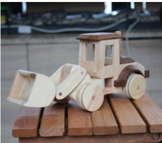
AHŞAP OYUNCAK KEPÇE Tavşanlı T Tipi Kapalı ve Açık Ceza İnfaz Kurumu İşyurdu Müdürlüğü Fiyat : 450 TL