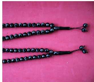
AYYILDIZ GÜMÜŞ İŞLEMELİ OLTU TESBİH Oltu T Tipi Kapalı Ceza İnfaz Kurumu İşyurdu Müdürlüğü Fiyat : 3000 TL