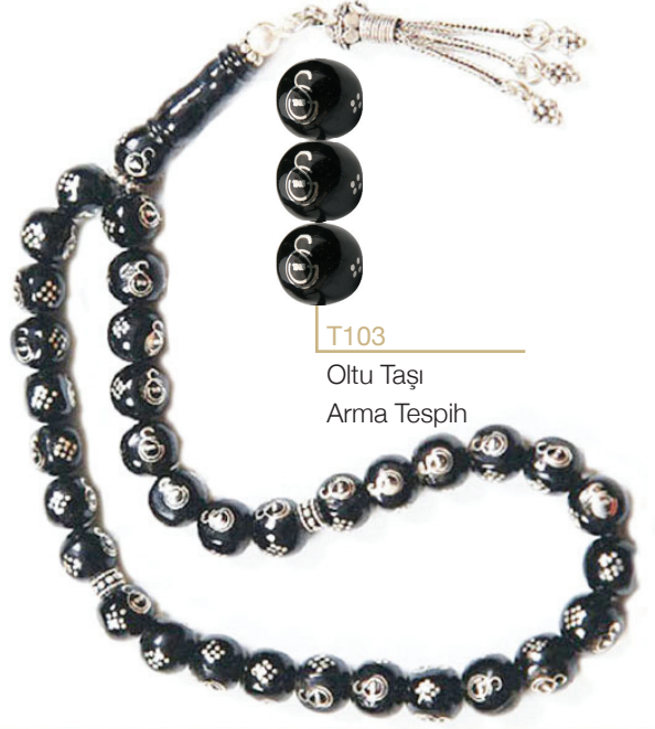
T103 Oltu Taşı Arma Tespih