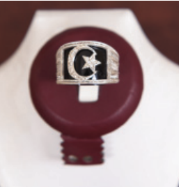
T121 Gümüş Takı Çeşitleri