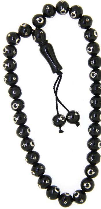
T109 Ayyıldız İşlemeli Tespîh