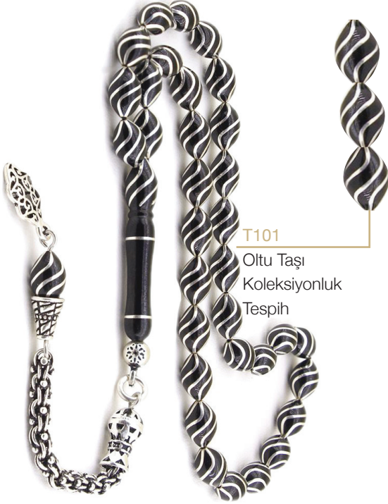
T101 Oltu Taşı Koleksiyonluk Tespîh