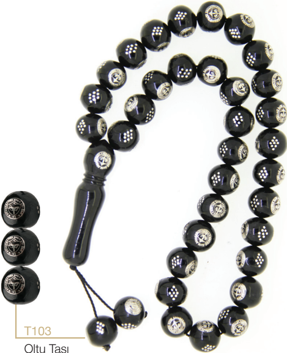
T103 Oltu Taşı Arma Tespih