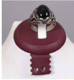
T121 Gümüş Takı Çeşitleri