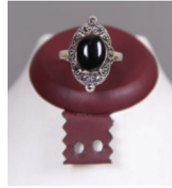
T121 Gümüş Takı Çeşitleri

OLTU ZÜMRÜDÜ TAŞI: Karadeniz Teknik Üniversitesinin yapmış olduğu bir bilimsel araştırmada Oltu- Şenkaya ilçeleri çevresinde 31 çeşit Opal taş tespit edilmiş olup, bunlardan Emerald Opal' in (Zümrüt Opal) dünyada bir tek bu bölgede bulunduğu tescil edilmiştir. Halk arasında Osmanlı Zümrüdü olarak da bilinmektedir.