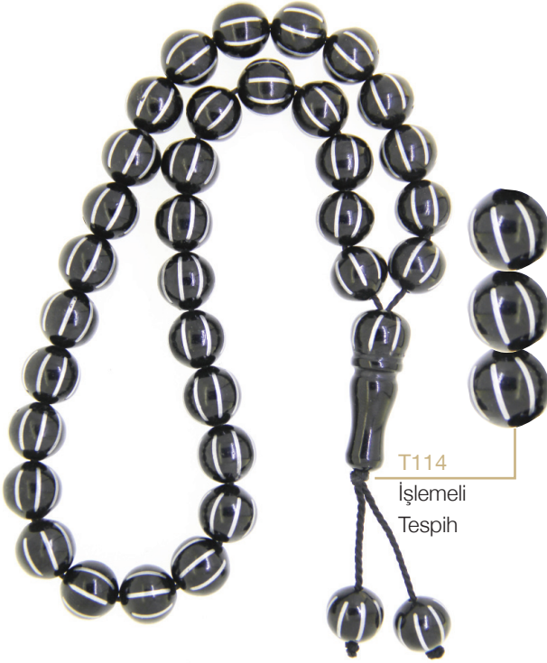
T114 İşlemeli Tespîh