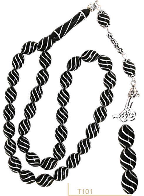
T101 Oltu Taşı Koleksiyonluk Tespîh