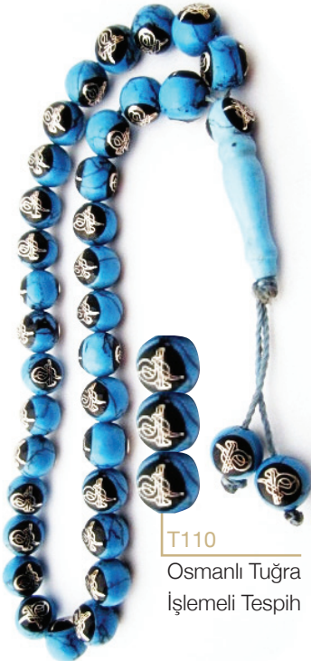
T110 Osmanlı Tuğra İşlemeli Tespîh