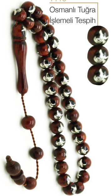
T110 Osmanlı Tuğra İşlemeli Tespîh