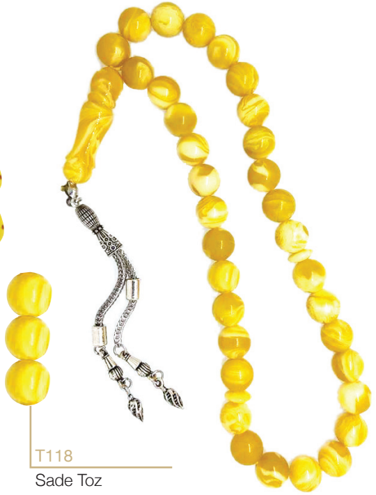
T118 Sade Toz Kehribar