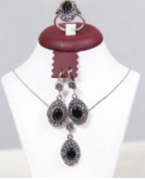
T121 Gümüş Takı Çeşitleri