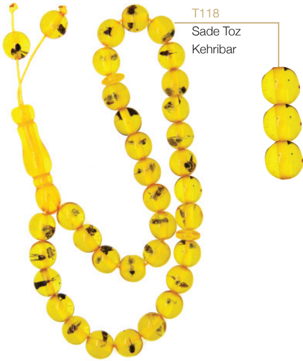
T118 Sade Toz Kehribar