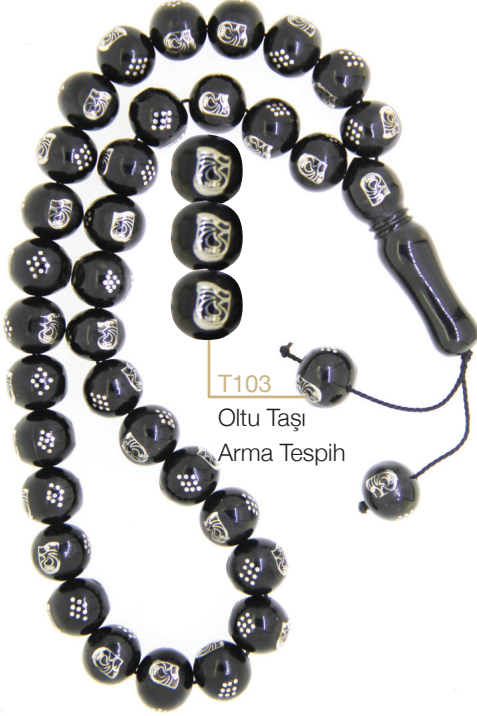
T103 Oltu Taşı Arma Tespih