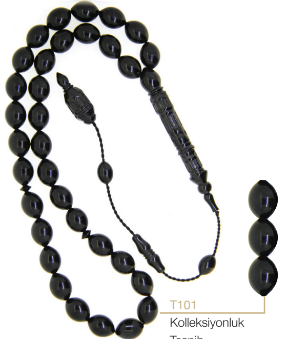
T101 Koleksiyonluk Tespîh