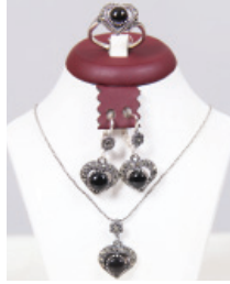
T121 Gümüş Takı Çeşitleri