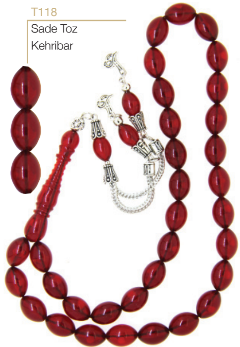
T118 Sade Toz Kehribar