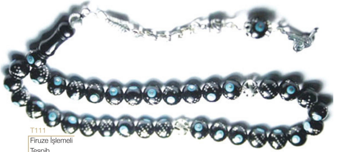
T111 Firuze İşlemeli Tespîh