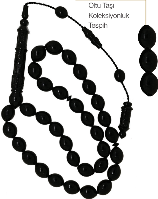
T101 Oltu Taşı Koleksiyonluk Tespîh