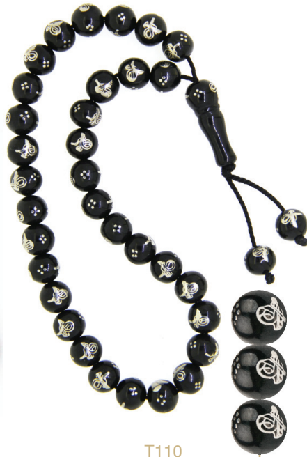
T110 Osmanlı Tuğra İşlemeli Tespîh