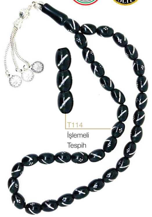
T114 İşlemeli Tespîh