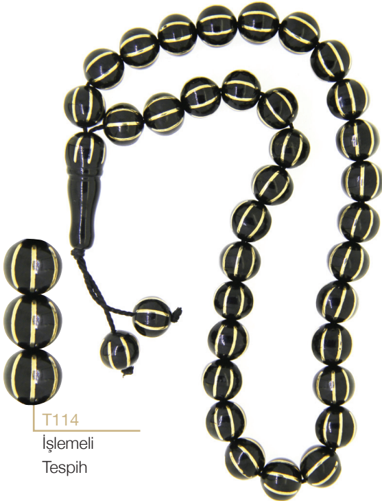
T114 İşlemeli Tespîh