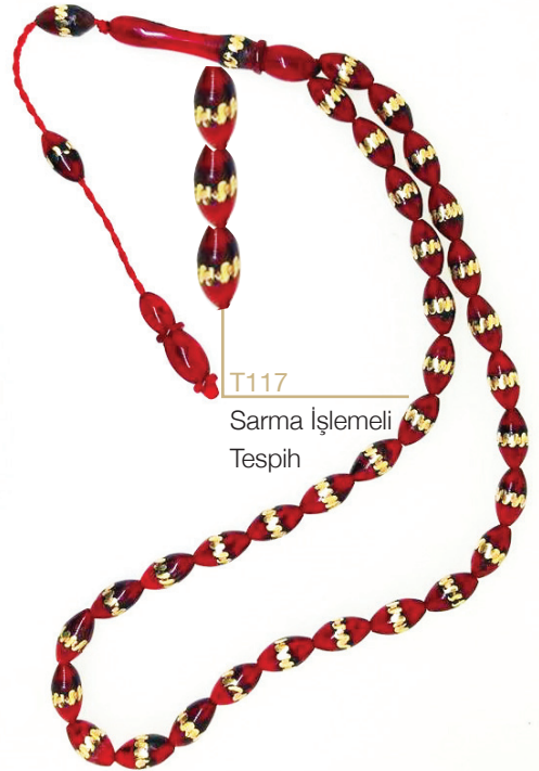
T117 Sarma İşlemeli Tespîh