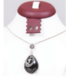
T121 Gümüş Takı Çeşitleri