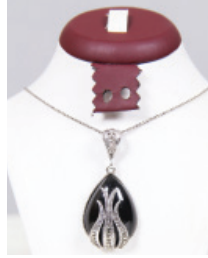
T121 Gümüş Takı Çeşitleri