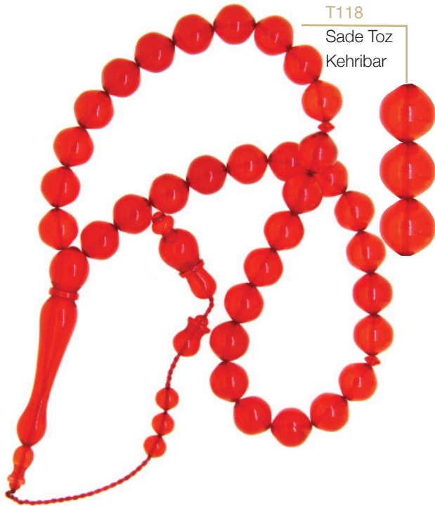
T118 Sade Toz Kehribar