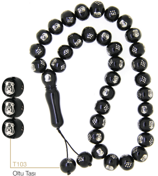
T103 Oltu Taşı Arma Tespih