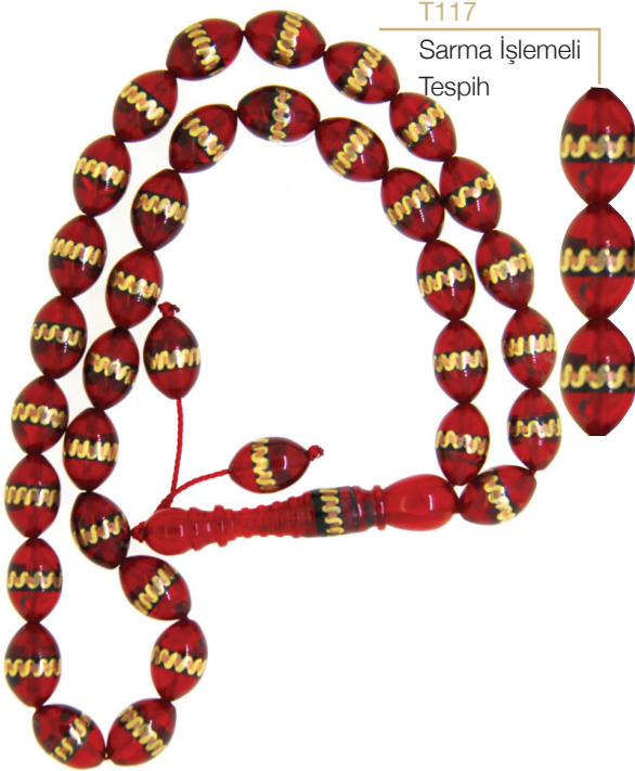
T117 Sarma İşlemeli Tespîh