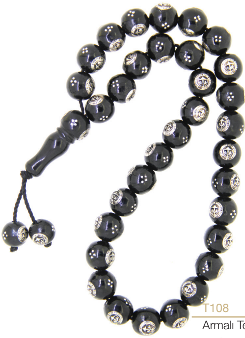
T108 Armalı Tespih