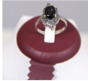
T121 Gümüş Takı Çeşitleri