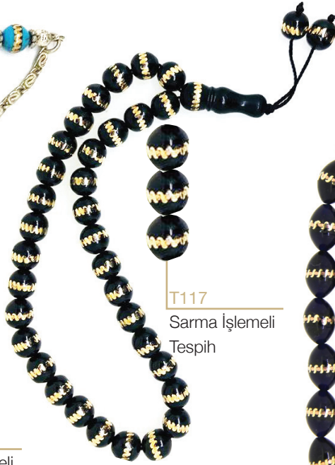
T117 Sarma İşlemeli Tespîh