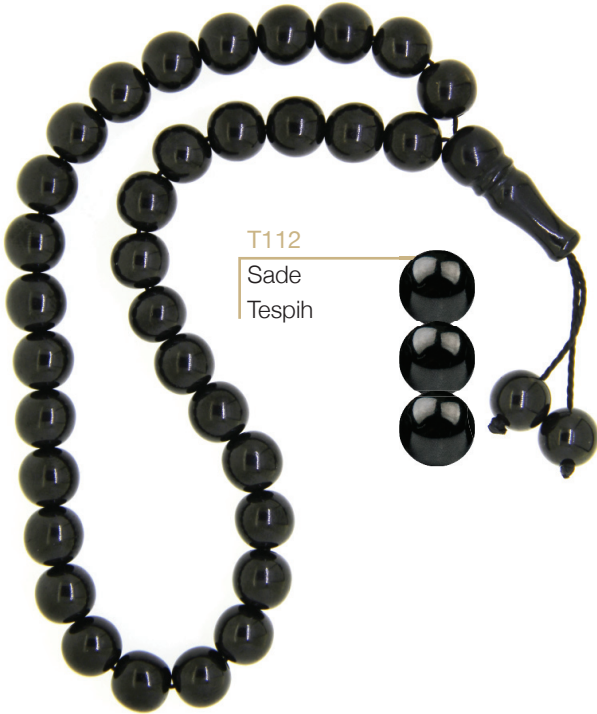
T112 Sade Tespîh