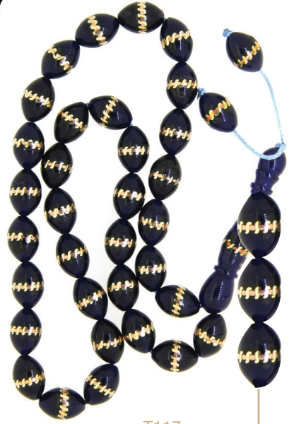
T117 Sarma İşlemeli Tespîh