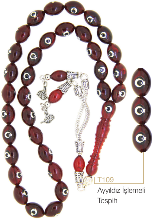
T109 Ayyıldız İşlemeli Tespîh