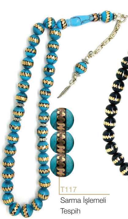
T117 Sarma İşlemeli Tespîh