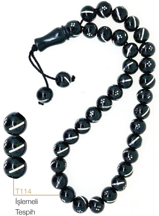
T114 İşlemeli Tespîh