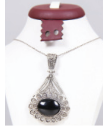
T121 Gümüş Takı Çeşitleri